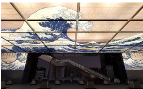
〈3階ひろば映像投影〉